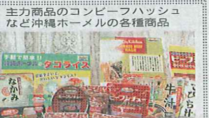
主力商品のコンビーフハッシュなど沖繩ホームの各種商品

セージ ユアル 検査す 国際 宙食製 た総合 CCP 安全 県産 シチュ 共同開 を原料 発した シュは 原料と 発も今 約2 と無添 ソンチヨ たコー